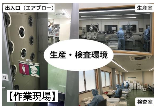
出入口 (エアブロー)