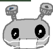
耳が痛くなりにくいよ